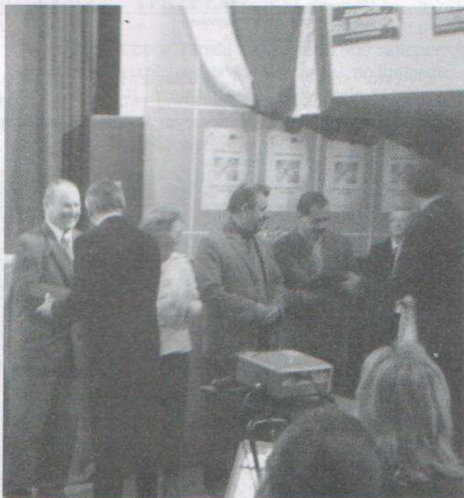
Delegacja gminy Rajgród