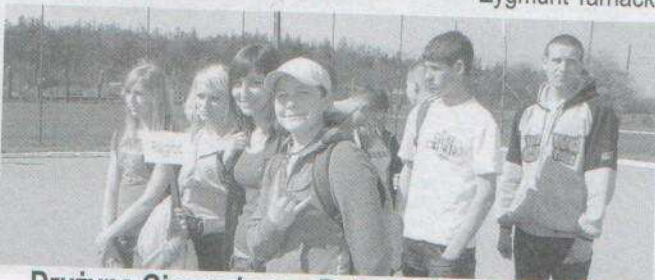
Drużyna Gimnazjum w Rajgrodzie na memoriale