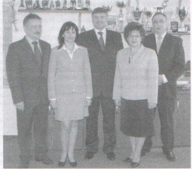
Zarząd Powiatu Grajewskiego