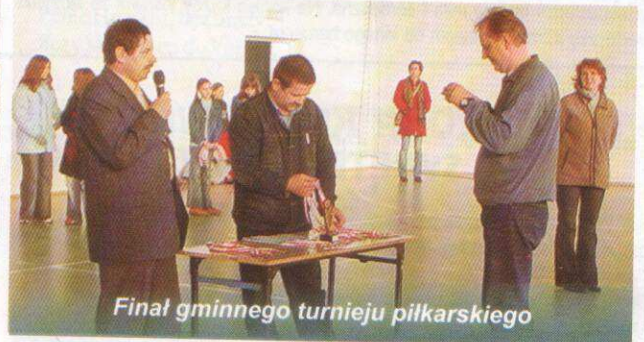
Finał gminnego turnieju piłkarskiego