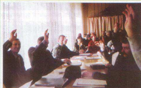
SESJA RADY MIEJSKIEJ Uchwalenie budżetu gminy Str. 3