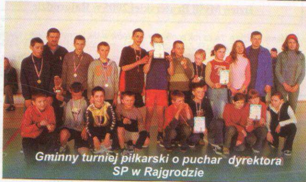
Gminny turniej piłkarski o puchar dyrektora SP w Rajgrodzie