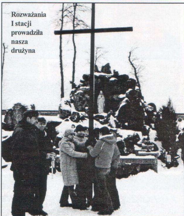
Rozważania i stacji prowadziła nasza drużyna