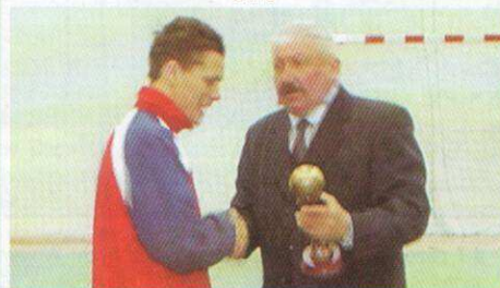
SPORT W GMINIE RAJGRÓD Obłężenie nowej hali sportowej Str. 12