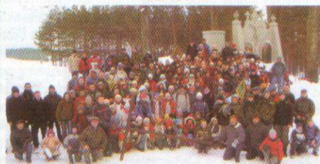
DZIEŃ MYŚLI BRATERSKIEJ Rajgradzcy harcerze nadal bardzo aktywni Str. 19