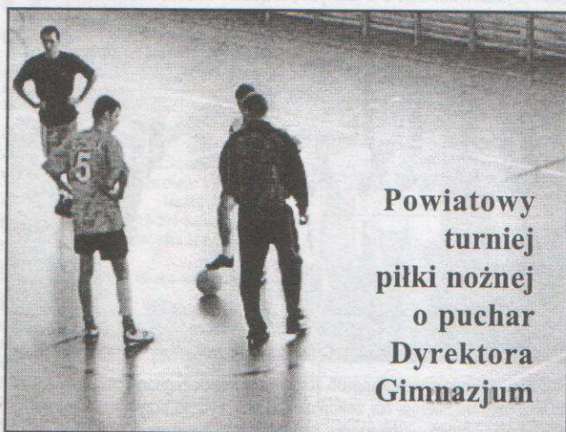
Powiatowy turniej piłki nożnej o puchar Dyrektora Gimnazjum