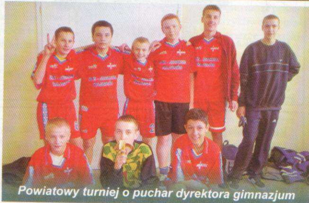
Powiatowy turniej o puchar dyrektora gimnazjum