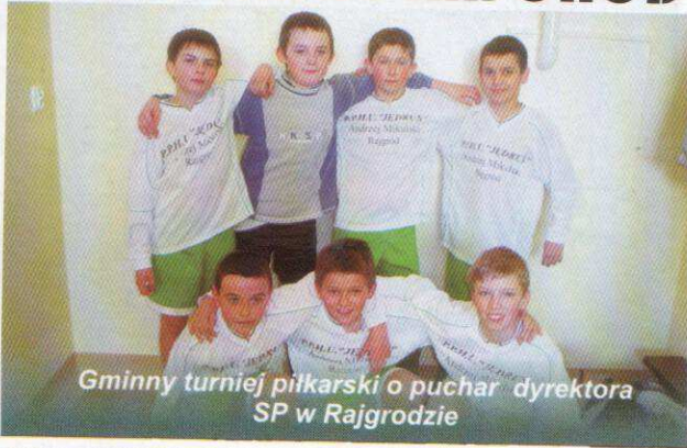
Gminny turniej piłkarski o puchar dyrektora SP w Rajgrodzie