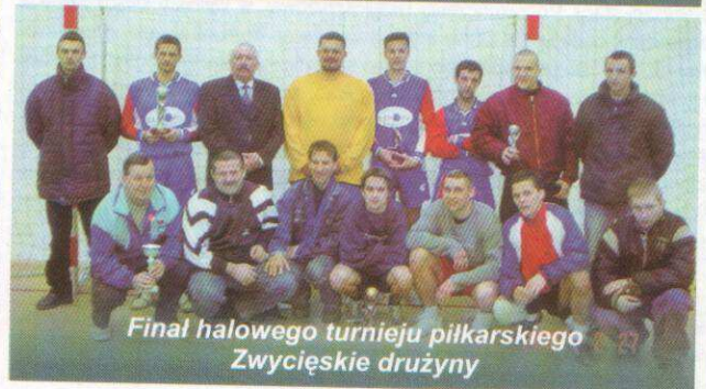
Finał halowego turnieju piłkarskiego Zwycięskie drużyny