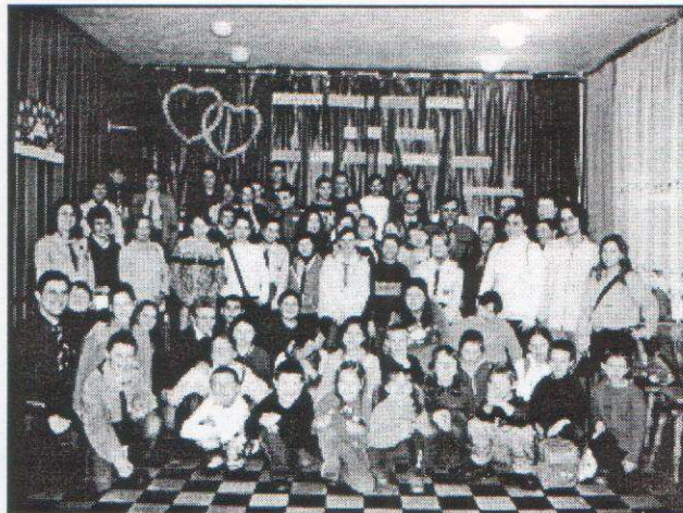
Dzień Myśli Braterskiej 2005 w Rajgrodzie

Mamy nadzieję, że za rok spotkamy się znów w tak licznym gronie i równie miło razem spędzimy ten dzień.