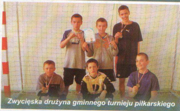
Zwycięska drużyna gminnego turnieju piłkarskiego