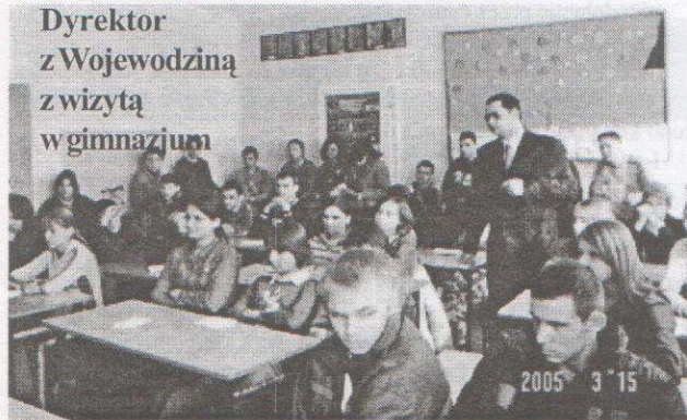
Dyrektor z Wojewodziny z wizytą w gimnazjum

Tradycyjny Dzień Samorządności w tym roku odbył się w szkołach na terenie gminy Rajgród w dniu 23 marca. Samorządy uczniowskie przygotowały konkursy, zawody i turnieje sportowe. Mimo jeszcze zimowej aury nastroje uczestników były już wiosenne.