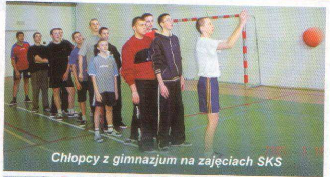
Chłopcy z gimnazjum na zajęciach SKS