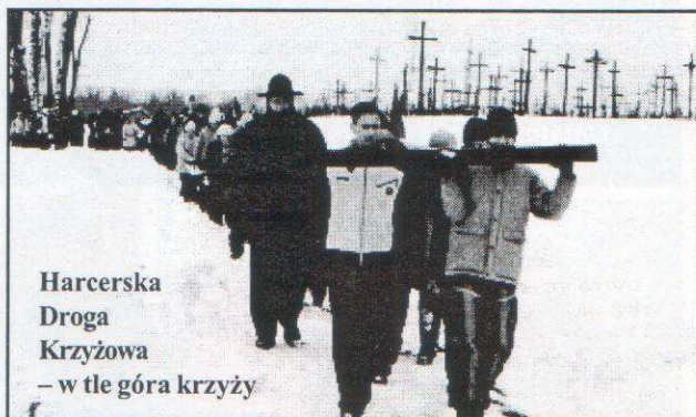
Harcerska Droga Krzyżowa – w tle góra krzyży