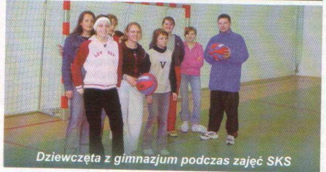
Dziewczęta z gimnazjum podczas zajęć SKS