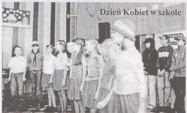
Dzień Kobiet w szkole

dzieci. Omówiono również sposób zorganizowania pożegnania absolwentów na koniec roku szkolnego. Na zakończenie, nauczyciele przygotowujący raport z mierzenia jakości pracy szkoły, przeprowadzili wywiady z określoną grupą rodziców.