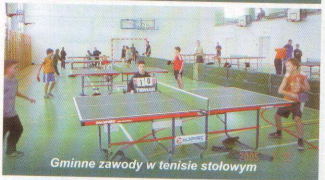
Gminne zawody w tenisie stołowym

„RAJGRODZKIE ECHA” - PISMO TOWARZYSTWA MIŁOŚNIKÓW RAJGRODU