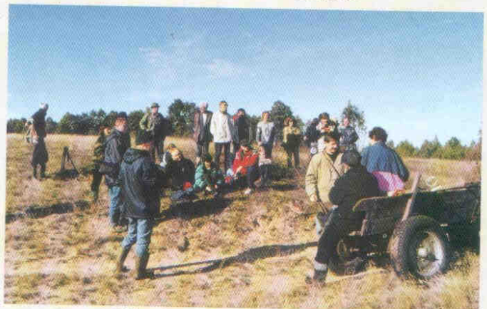
reżyser J. Wierzbicka opowiada o historii wsi Grzędy