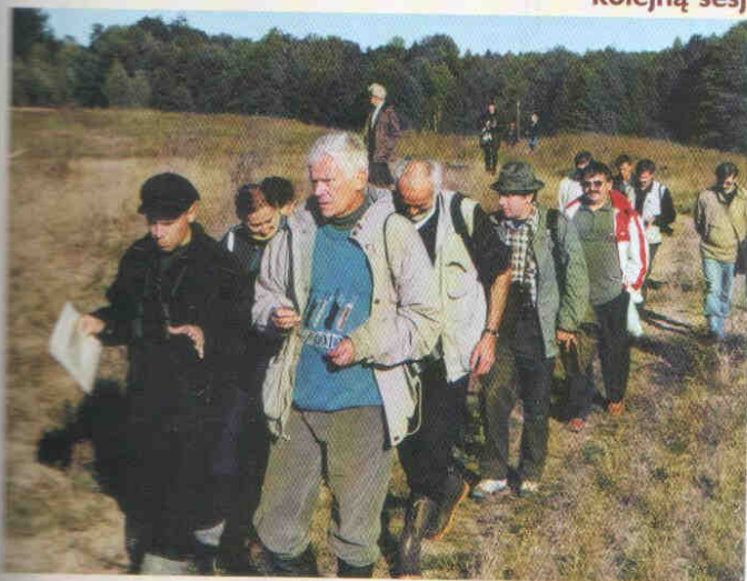
w Biebrzańskim Parku Narodowym; przemarsz po Czerwonym Bagnie