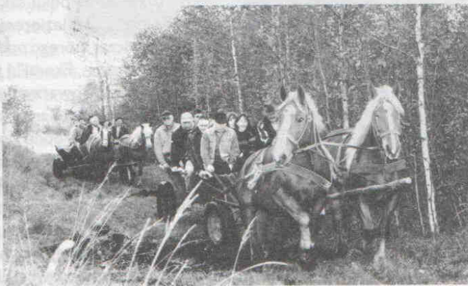
przejazd furmankami po Grzędach