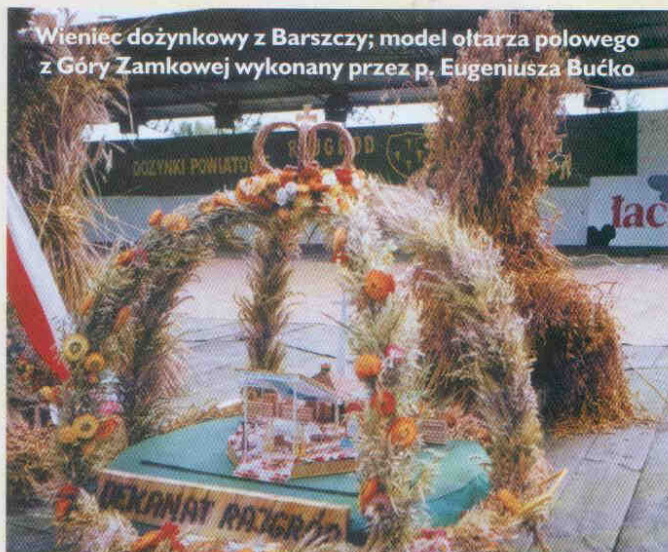
Wieniec dożynkowy z Barszczy; model ołtarza polowego z Góry Zamkowej wykonany przez p. Eugeniusza Bućko