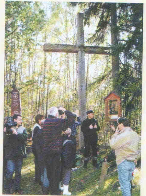
wycieczka do Biebrzańskiego Parku Narodowego; Grzędy – przy powstańczym krzyżu z 1863 r. i pomniku – obelisku