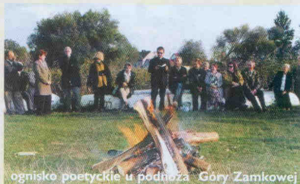
ognisko poetyckie u podnoża Góry Zamkowej